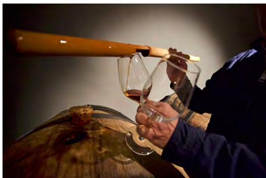
Fondillon, un vino para la eternidad